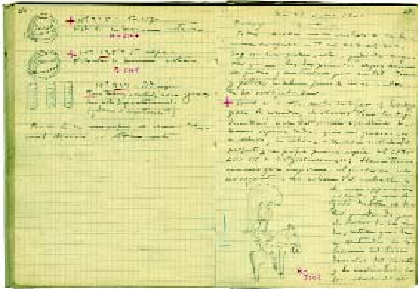
Pàgina del diari d'excavació de la Bastida de les Alcusses (Moixent) on es recull l'aparició del Guerrer de Moixent. 1931.

publicar-lo fins que no ho fóra el de M. Gómez Moreno, segons indica L. Pericot a I. Ballester en carta personal el 13 de juny de 1933 (Arxiu SIP).