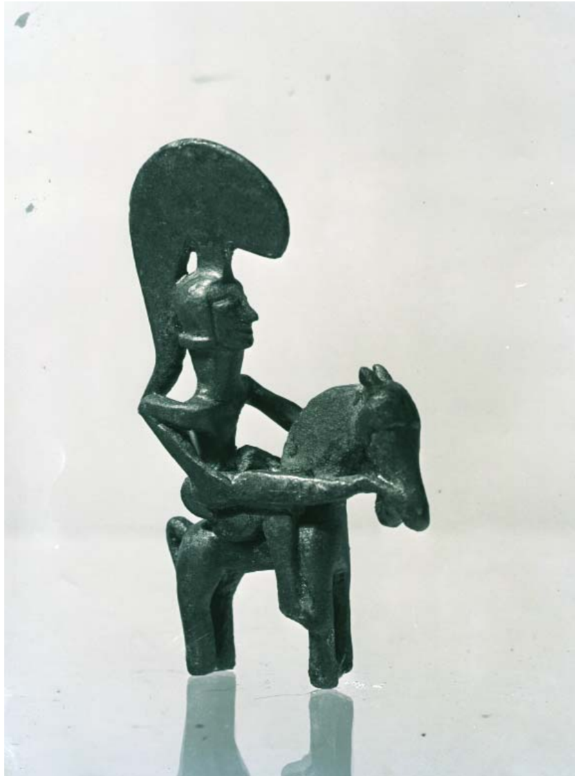
Figura de bronze coneguda com a Guerrer de Moixent. 1931. [Casa Grollo. Placa de vidre. SIP 1.326]

La ressonància en la comunitat científica no va ser igual a la del plom, i no obstant la peça del Guerrer s'ha convertit en una de les icones del museu i també en un element identitari del municipi de Moixent. L'impacte inicial no és comparable al plom perquè, primer que res, les circumstàncies institucionals no són les mateixes. Si durant el període entre 1928 i 1931 s'arreglaven alabances a la gestió i investigacions mampreses i es difonia la labor en fòrums científics, en 1932 el SIP sofria una reducció de dos terços en la seua assignació pressupostària que acabaria minant no sols la intensitat dels treballs sinó també la seua divulgació, afectant l'excavació en la Bastida, a pesar que el jaciment havia sigut