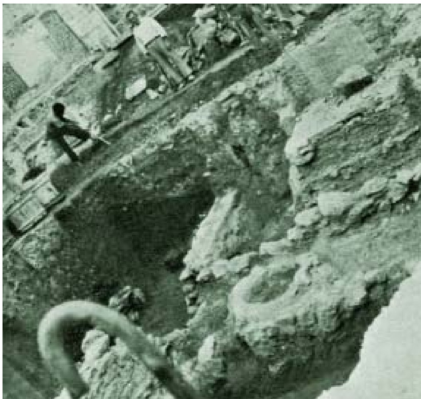
Vista general de l'excavació en el Palau de la Generalitat (València). Imatge publicada en l'APL II. 1945.

La primera excavació d'època romana del SIP es va fer en la ciutat de València en 1945, en el subsòl del Museu, i va estar motivada per les obres d'ampliació en el Palau de la Generalitat (Ballester, 1949a: 7). Va suscitar un interès general davant la possibilitat de trobar restes del primitiu assentament, que llavors es creia d'origen ibèric, i el seu estudi va ser publicat pel Servei (Gómez Serrano, 1945). Des de l'any 1948 que es va crear un Servei d'Investigació Arqueològica Municipal (SIAM) a València, este va atendre els assumptes d'arqueologia en la ciutat.