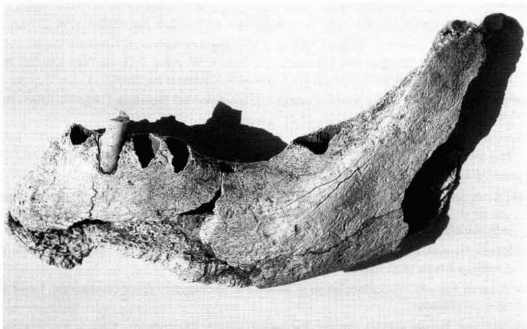
Lám. II.- Masadeta. Reabsorción alveolar, molares 36 y 37, por caída antemortem.