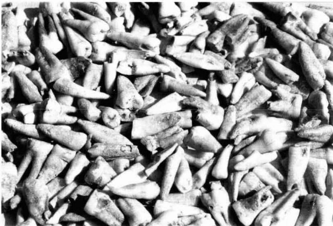
Lám. I.- Masadeta. Forma de presentación de los dientes.