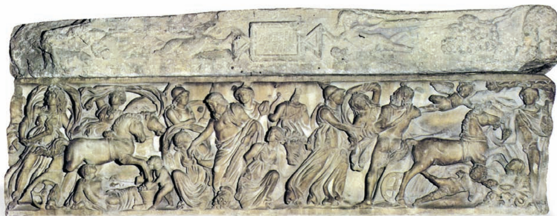
El sarcòfag anomenat de Proserpina es recuperà del mar en els entorns del Portus Ilicitanus (Santa Pola, Alacant). [Museu d'Arqueologia de Catalunya].

Deu el seu nom a la història de la deessa que du esculpida i il·lustra el seu rapt a mans de Plutó, déu de l'Hades, i la incessant cerca de sa mare. Es data a la fi del segle II, i és un sarcòfag de fris continu dels més antics d'Hispania.