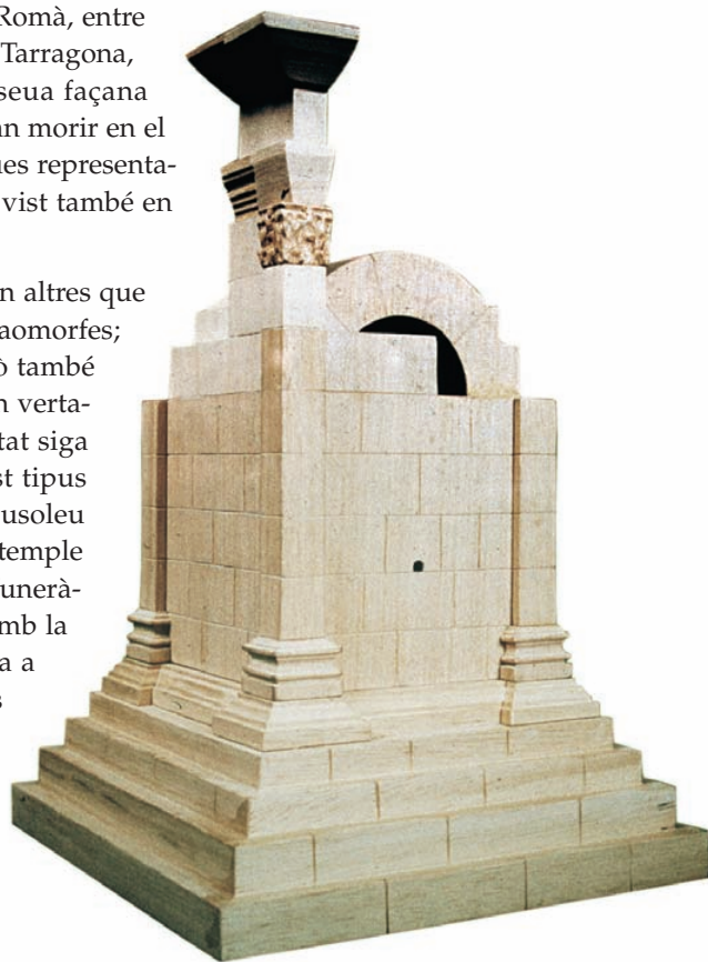
Restitució parcial de la Torre de la Vila Joiosa (Alacant). [Maqueta de C. Salvadores sobre proposta de L. Abad i M. Bendala].

En les terres valencianes hi hagué almenys un monument d'aquest tipus dedicat a la família dels Sergii , a