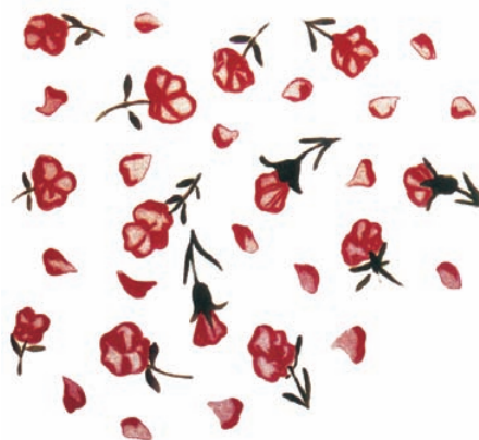
Decoració desapareguda del sostre de la tomba del Banquet, en la necròpolis de Carmona (Sevilla), segons R. Jaldón. Segle I.

A vegades, la superestructura funerària pot adquirir la forma d'un edifici d'un pis o més, els anomenats monuments turriiformes, molt estesos en tots els territoris de l'Imperi Romà. La seua versió més antiga és la que s'inclou sota la denominació comuna de monuments de fris dòric; estan compostos per un sòcol motlurat, un cos quadrangular coronat per un fris amb tríglifs i mètopes –d'on els ve el nom– i decorat, quasi sempre, amb caps de bous i rosetes; són aquests els motius que trobem en diversos carreus d'un monument de Sagunt, identificat fa alguns anys com a tal per Almagro Gorbea.