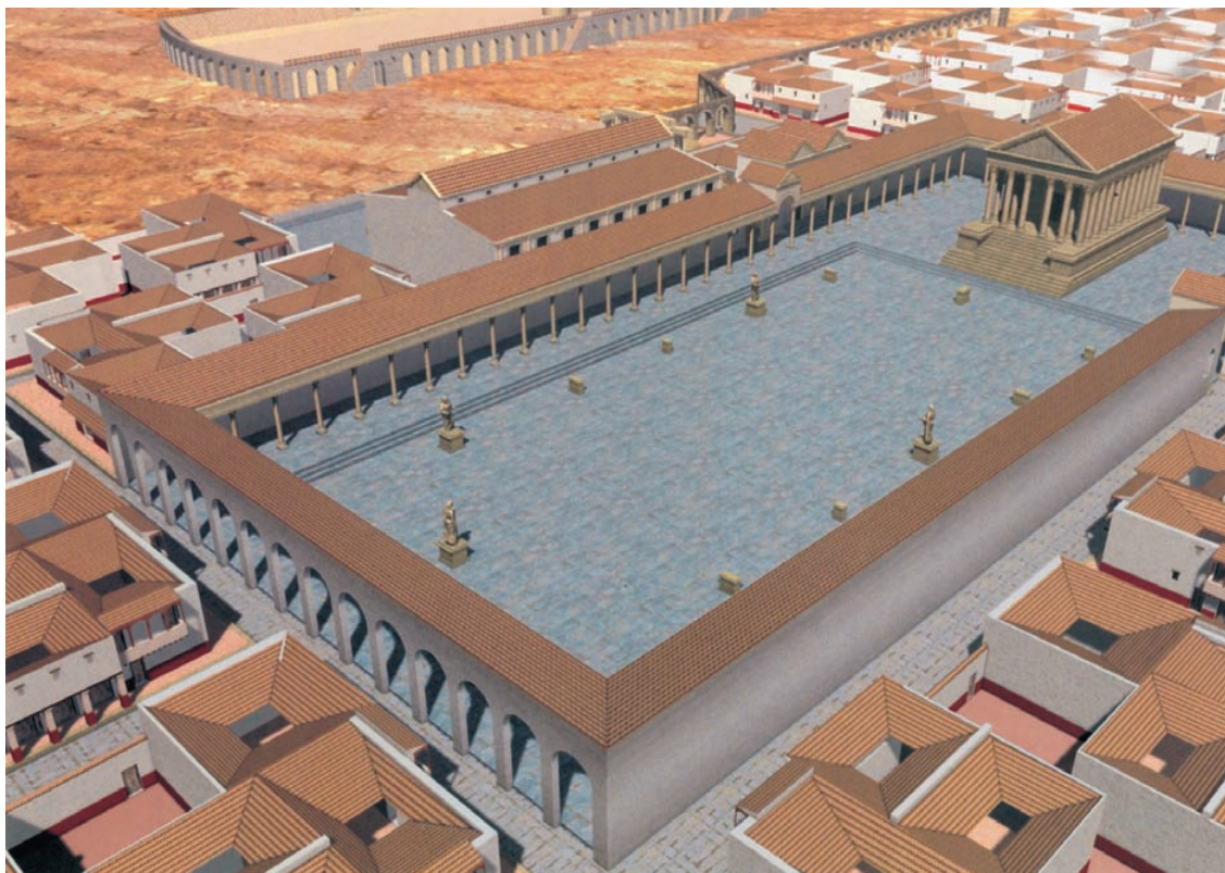
Fòrum de Valentia en època imperial.

El temple estava situat en l'àrea on s'alça la catedral gòtica. Al fons, el circ romà, en el límit oriental de la ciutat romana.