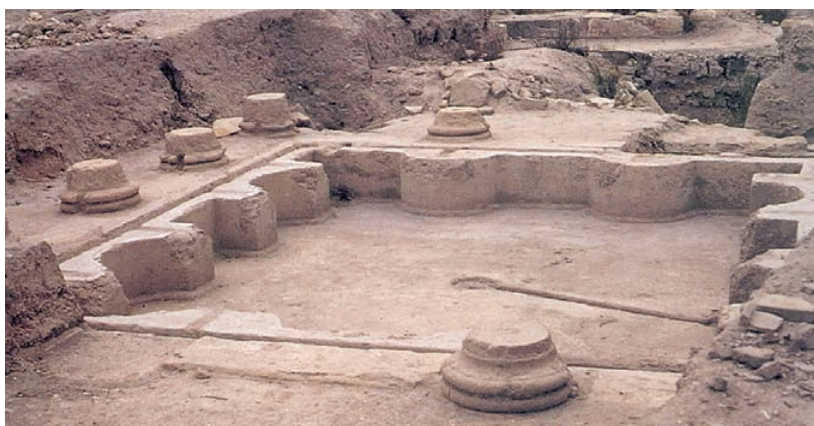
Domus d'Ilici (l'Alcúdia d'Elx, Alacant).

A Edeta la ciutat romana també apareix completament desplaçada del nucli anterior indígena situat al tossal de Sant Miquel, el qual després de la destrucció de principi del segle II aC mostra escassa presència humana fins a un moment indeterminat del segle I aC. El que es constata és una ocupació en aqueixos dos segles de llocs en pla, mai com a entitat urbana definida sinó dedicades molt possiblement a l'explotació agrícola.