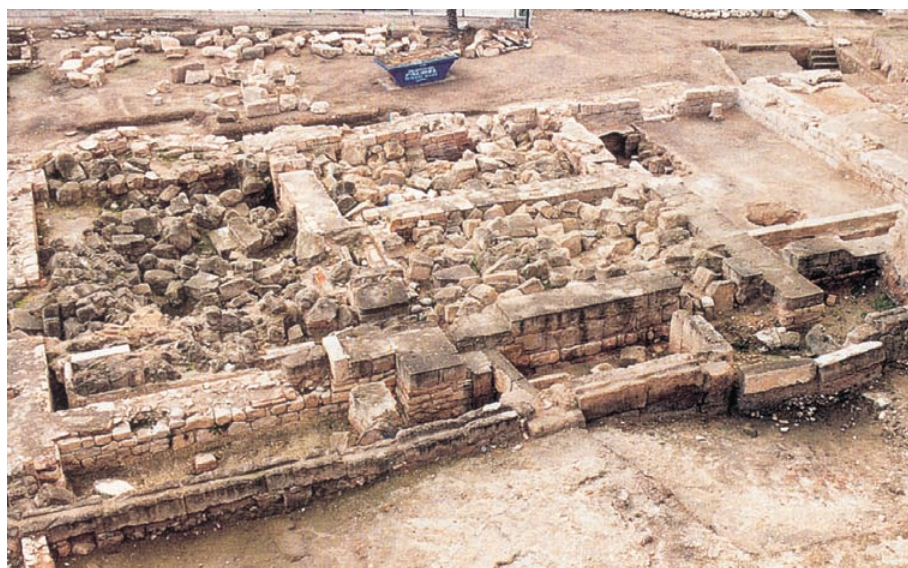
Vista de les termes de la partida de Mura, a Llíria (València). Darreries del segle I.

El cas de Dénia suposa la fundació d'una entitat urbana sense continuïtat amb l'emplaçament anterior. Aquest enclavament havia sigut la base naval de Sertori, i els vestigis arqueològics n'indiquen una ocupació de la primera meitat del segle I aC en el vessant septentrional del tossal del castell on es conserva alguna construcció de carreus interpretada com a part de la fortificació. Ja que no hi ha