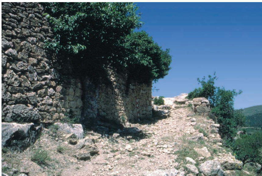
Entrada al recinte de Lesera (La Moleta dels Frares, Castelló). [Fot. F. Arasa].

La més septentrional de les ciutats romanes valencianes ve rebre l'estatut municipal a època flàvia. Fou abandonada al segle III.