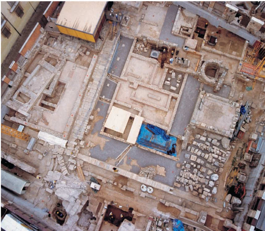
Vista de l'excavació de l'Almoina (València).

Els circs són les majors construccions, en superfície, de tot el món romà, capaços d'albergar milers d'espectadors àvids de contemplar carreres de carros. La seua forma és allargada, amb les grades perimetrals i una barrera central ( spina ) al voltant de la qual competien els carros. A causa del seu cost elevat i de l'enorme superfície de terreny que requereix és l'edifici d'espectacles menys construït. Per això només estan presents en les ciutats més importants. En terres valencianes, a Sa-