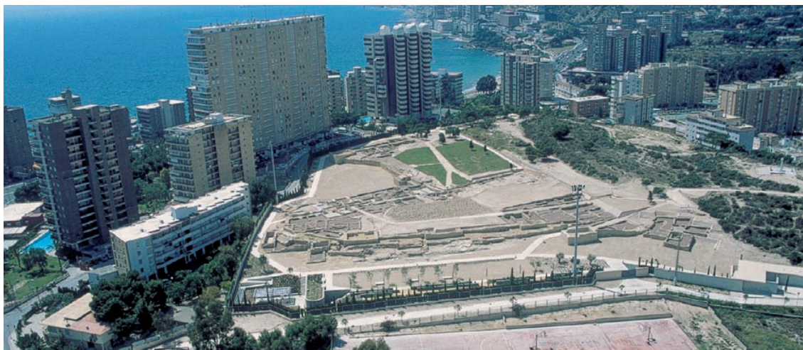
Vista aèria del Tossal de Manises (Lucentum).

L'antiga capital meridional dels contestans es converteix de facto en la colònia d' Ilici en època augustea, probablement cap al 27 aC i amb deductio , és a dir, amb instal·lació d'un contingent humà i repartiment de terres. Van ser legionaris veterans, com testimonia una emissió monetal del 19 aC. A més dels espais i els edificis oficials necessaris per a desenvolupar la nova condició jurídica, el contingent de ciutadans romans arribats hi promouria aquelles construccions que donaren satisfacció al seu estil de vida. Els uns i els altres suposarien una autèntica revolució urbana i arquitectònica de la qual en realitat poc sabem per ara. Consta l'erecció d'un temple a Juno la façana del qual es mostra en una emissió monetal un poc posterior a l'any 12 aC. La imatge representa un temple sobre pòdium amb quatre columnes en la part anterior. Recentment s'ha excavat un sector que s'ha identificat amb el fòrum, en el qual es troben dos temples. El que s'ha exhumat per complet no correspondria per la seua forma al que s'ha il·lustrat en les monedes, ja que presenta només dues columnes en façana.