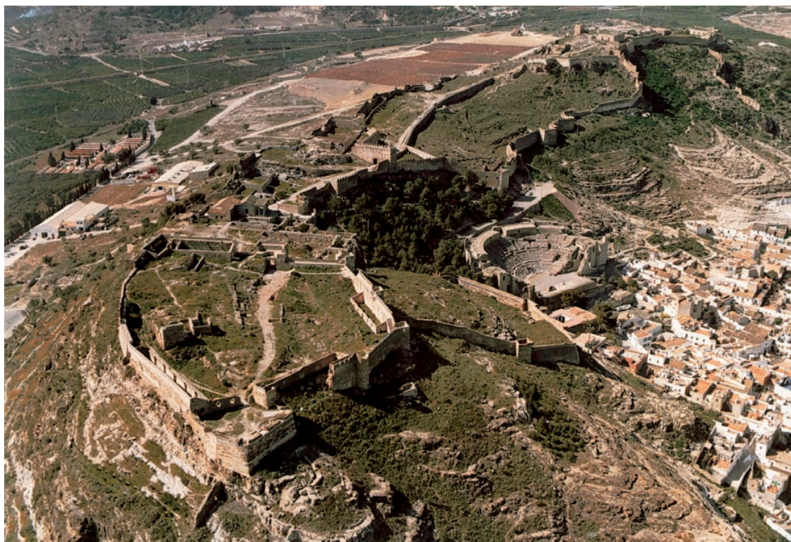
Vista aèria de Sagunt (València). [Paisajes españoles].

A Lucentum la renovació urbana començarà a mitjan segle I aC i s'intensificarà en època augustea amb l'esperó en aquest moment de la concessió de l'estatut de municipi. Entre aquella data i primeries del segle I es plasma la trama urbana amb xarxa de carrers que tendeixen a l'ortogonalitat delimitant insulae de variada extensió. Aquesta distribució no té res a veure amb l'ocupació precedent, tal com anem coneixent a partir de les últimes excavacions. Amb August s'alça en el centre de la ciutat el fòrum, que actualment està en procés d'excavació i apareixen els primers edificis típics romans com les termes que mostren encara trets dels edificis balnearis republicans (amb l' hypocaustum limitat a la banyera i el caldari). A mitjan segle I aquestes seran reformades per M. Popili Onyx, sacerdot del Cult Imperial, i molt probablement un llibert ric, que sufragava amb aquesta obra i un temple (conegut per l'epigrafia) part de l'escenari arquitectònic d'aquesta ciutat menuda que no superà, intramurs, les 3 ha d'extensió.