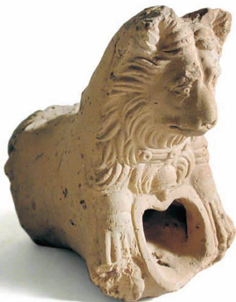
Gàrgola de terracota amb forma de gos. Roma. Època Imperial. [Museu de Prehistòria de València].

En el cas valencià, el primer impuls només abastà quatre ciutats: Saguntum , Saitabi , Ilici i Lucentum . No és casual aquesta llista ja que són vells nuclis preromans en els quals, almenys en les tres primeres, no s'adverteix trencament de poblament i semblen haver sigut afavorides per Roma des del primer moment de conquesta o més tard (el cas de Lucentum ). Són ciutats que, per la seua evolució històrica, estarien en condicions d'assumir el nou estatus i reformar el paisatge construït.