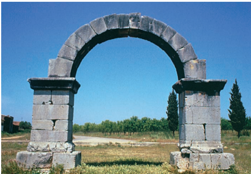
L'Arc de Cabanes (Castelló). Segle II.

Els programes decoratius de les vil·les comprenen fonamentalment escultures i paviments mosaics, a més de la pintura mural, els estucs i els revestiments de marbre. Entre les primeres es troben escultures de jardí com les hermes de Bacus del Mas de Víctor (Rossell), el Cabeçolet (Sagunt) i Fondos (Torís), i l' oscillum de Can Porcar (Llíria). Retrats imperials com el d'Adrià del Palmar (Borriol). Entre l'escultura ideal hi ha representacions de Bacus com les de l'Ereta dels Moros (Aldaia) i del Trull dels Moros (Sagunt); d'Afrodita com la de València la Vella (Riba-roja de Túria); de Nimfes