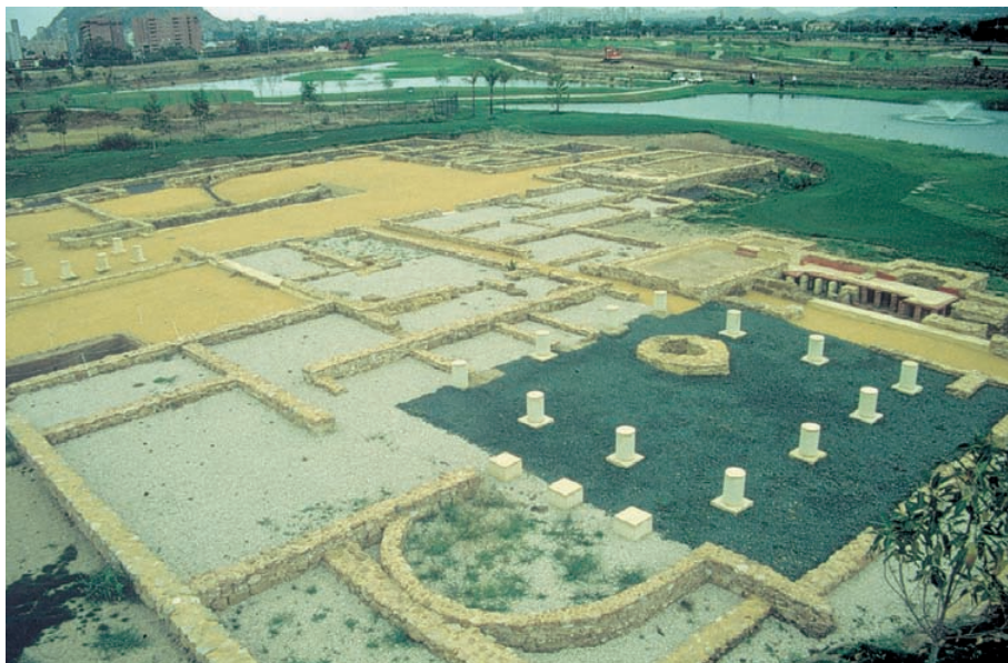
Vista de la vil·la romana de Casa Ferrer I, prop de Lucentum. Segles I-III.