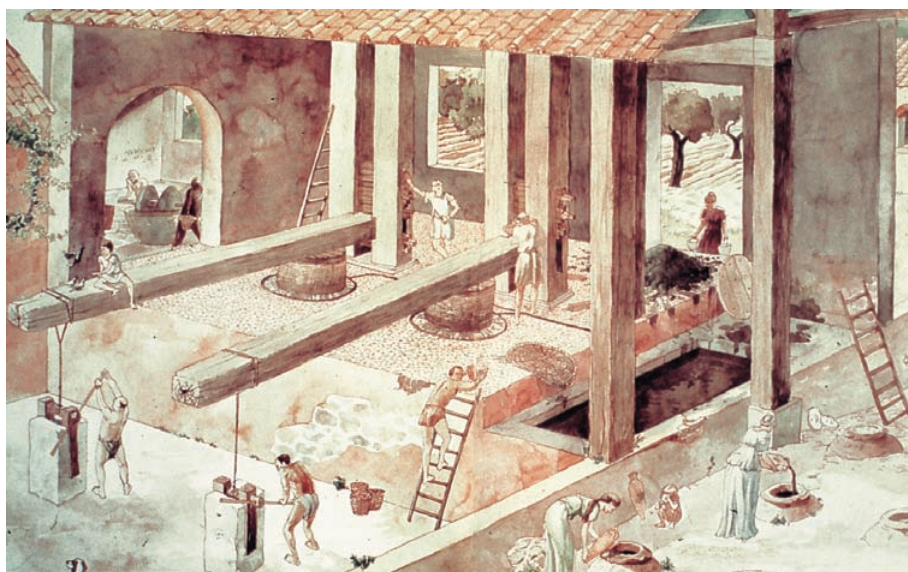
Recreació artística de la doble premsa trobada en l'almàssera (torcularium) de la vil·la romana del Parc de les Nacions (Alacant). [Dibuix P. Rosser-J. Sáez].

com algunes escultures (l'Ereta dels Moros a Aldaia) o mosaics (el Poaig de Montcada). Finalment, algunes han estat parcialment excavades, però els resultats de la investigació no han estat donats a conèixer més que de manera resumida (Benicató de Nules; el Circuit de Xest; el Parc de les Nacions d'Alacant; la Canyada Joana de Crevillent).