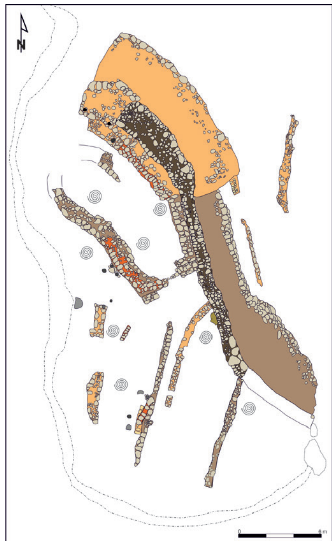
Figura 17.5. Plano de distribución de exoesqueletos marinos en Caramoro I.

Así bien, durante este periodo asistimos a una marcada disminución de las fuentes de subsistencia a explotar respecto a épocas precedentes, pasando la caza, la pesca y la recolección, entre la que incluimos la práctica de un marisqueo o laboreo de recursos malacológicos marinos, a constituir actividades minoritarias, e incluso ocasionales, de una alimentación basada en la ganadería, de ovicápridos y bóvidos (Lull y Risk, 1995: 105; Ruiz et al. , 1992) y el cultivo del cereal de secano, como el Triticum monococcum y otros trigos desnudos y la cebada desnuda y vestida, junto a leguminosas como las habas y los guisantes y en menor medida las lentejas, Vicia sativa o Lathyrus sp. (Pérez, 2013: 176).