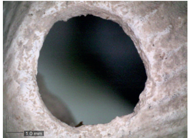
Figura 17.6. Detalle del proceso de abrasión y perforación efectuada en una de las conchas de Cardium edule del Espacio D.

Junto al estudio de las piezas malacológicas de origen marino, incluimos también el inventario de las especies terrestres recogidas durante la campaña de excavación 2015, que se resume en un total