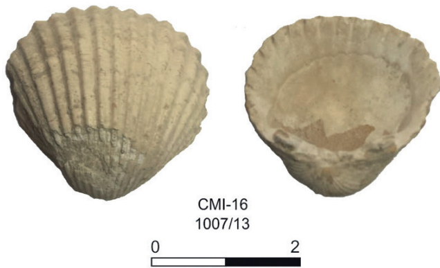
Figura 17.4. Concha de Cardium edule documentada en la UE 1007 del primer momento de ocupación del Espacio A.