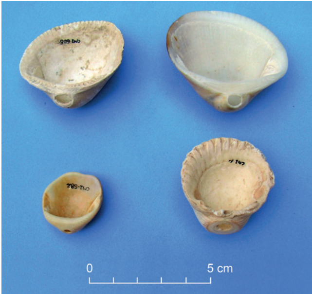
Figura 17.1. Malacofauna marina perforada correspondiente a las campañas iniciales en Caramoro I.