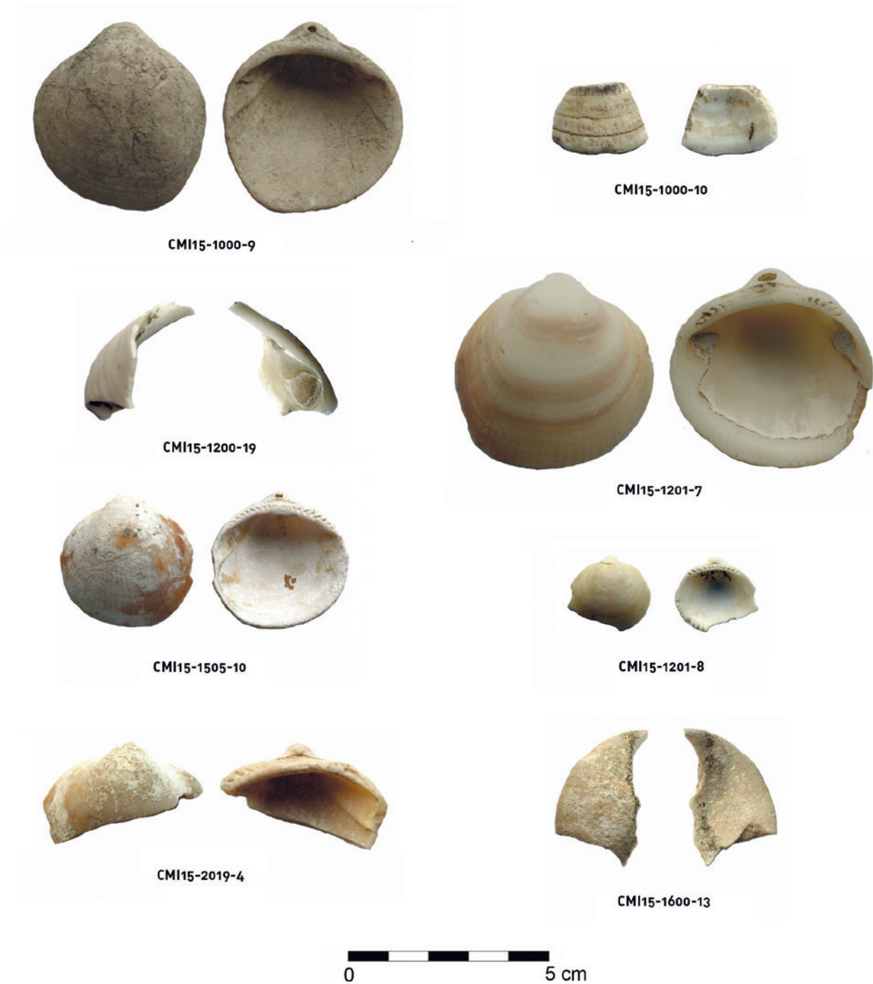
Figura 17.3. Glyciméridos documentados en la campaña de 2015 procedentes de los espacios A, C y D.

cuya presencia se asocia con una posible intrusión de carácter no antrópico en un momento posterior a la ocupación del yacimiento y su abandono (Luján, 2014: 251) así como otro individuo procedente de la UE 1200.