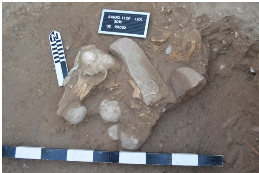
FIGURA 4. Estructura 151 de Sanxo Llop Lidl. Cráneo y otros restos de delfínido durante el proceso de excavación.

mitad, tres de un cuarto y 26 fragmentos de tamaño más reducido) (NME: 21), dos fragmentos de escápula (uno de la derecha y otro de la izquierda), un húmero, una ulna, un radio, 14 fragmentos de costilla y 94 pequeños fragmentos indeterminados. Estos restos no presentan alteración, todas las fracturas son postdeposicionales y algunas recientes consecuencia del proceso de excavación. No se observa ninguna evidencia de manipulación antrópica. En algunos casos estos huesos presentan modificaciones diagenéticas sobre la cortical vinculada a procesos químicos de las raíces de las plantas.