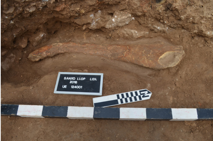
FIGURA 2. Estructura 124 de Sanxo Llop Lidl con la costilla de cetáceo antes de su extracción.

-UE 124.002, de 0,15-0,20 m de profundidad, formada por una importante concentración de grandes bloques y un sedimento arenoso poco compacto.