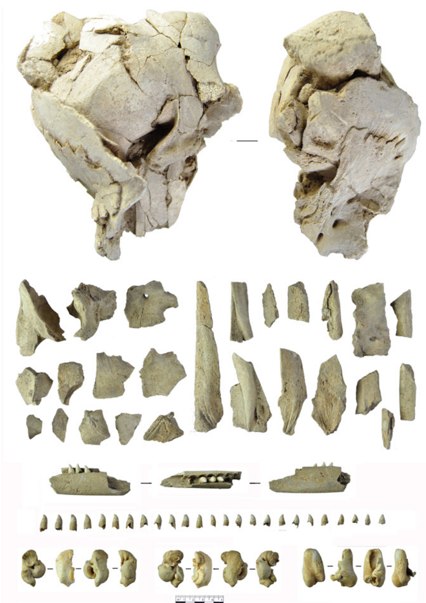
FIGURA 5. Esqueleto craneal de delfínido de la estructura 151 de Sanxo Llop Lidl.