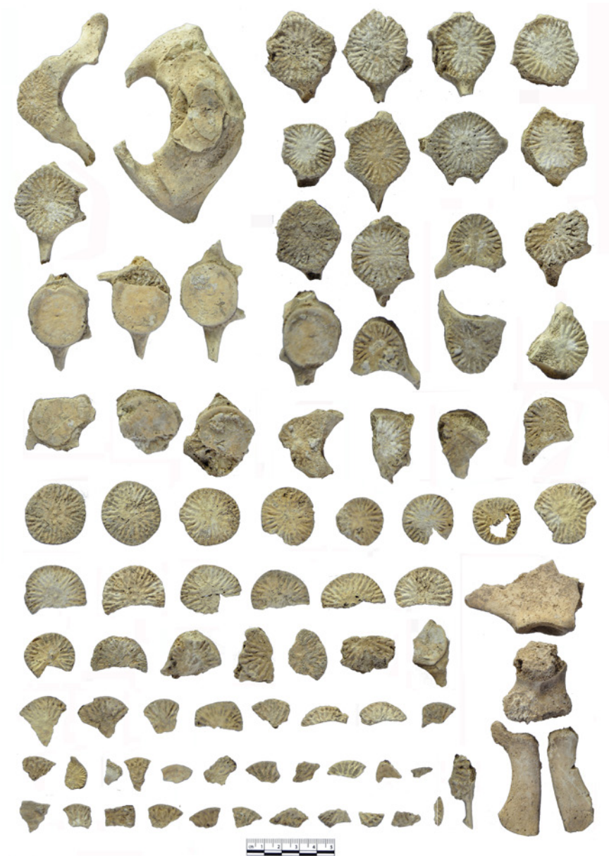
FIGURA 6. Esqueleto postcraneal de delfínido de la estructura 151 de Sanxo Llop Lidl.