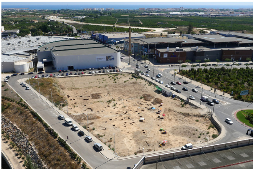
FIGURA 1. Sanxo Llop Lidl. Vista aérea de la excavación de 2016. A la izquierda se encontraba la Alquería de Sant Andreu y a la derecha La Vital.

arqueológicas en las que se han documentado abundantes estructuras, testigo de la amplia secuencia detectada en el yacimiento, con ocupaciones del Neolítico antiguo epicardial, calcolíticas, Bronce final, Hierro antiguo, romanas, islámicas, bajomedievales y contemporáneas. Para las fases prehistóricas la mayor parte de las estructuras son subterráneas, sobre todo silos y fosas, de las que se han excavado varios centenares (figura 1) y en menor número posibles estructuras de hábitat, hogares y enterramientos individuales o dobles, algunos de ellos asociados a depósitos animales (Pascual Beneyto et al., 2008; Pérez Jordá et al., 2011; García Borja et al., 2013; Pascual Beneyto, 2015).