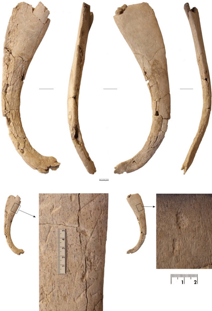
FIGURA 3. Costilla de cetáceo de la estructura 124 de Sanxo Llop Lidl.