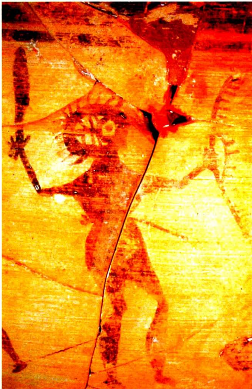
Guerrer ibèric amb escut vist de perfil i falcata (?). Poblats de Sant Miquel de Lliria (València). SIP.