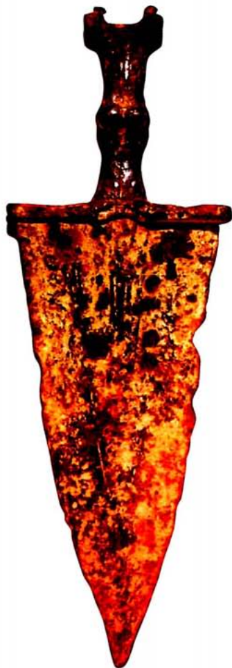
Punyal ibèric de fulla triangular, de dubtosa funcionalitat. Zagra. Museu de Granada.

Juntament amb les espases d'antenes, a partir de final del segle IV s'estengueren per l'Altiplà les versions locals de l'espasa de La Tène I gal·les, que modificaven sobretot la beina i el sistema de suspensió, més que no l'espasa en ella mateixa. Aquestes armes perduraren i aconseguiren una gran popularitat durant els segles III-II aC, mentre que en la pròpia Gàl·lia les havien substituïdes pels llargs espasons ja