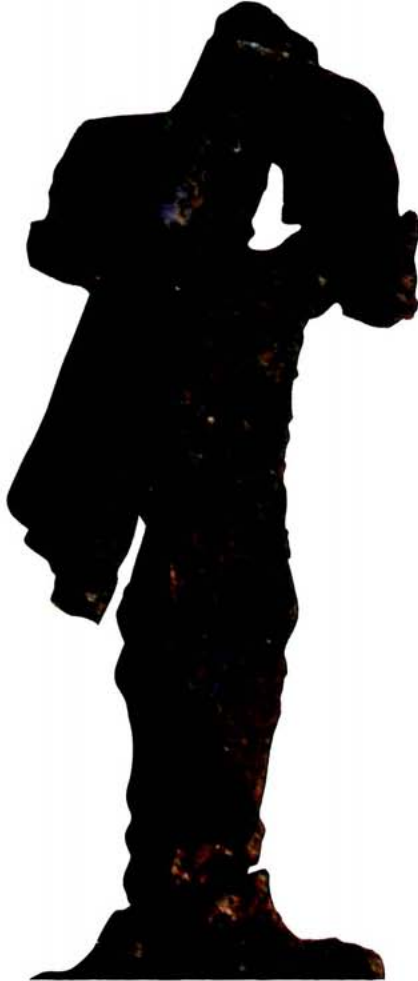
Detall de l'empunyadura d'una espasa de frontó, amb pont de bronze. Museu del SIP, València.

quan s'enfronten combatents sense protecció corporal (Bridgfoot, 1997: 113). En circumstàncies de batalla, quan el combatent ha d'esperar ser atacat des de diverses direccions i per diferents enemics protegits amb cuirasses, cascos i escuts, la situació pot ser ben diferent. Aleshores una espasa ropera (o rapière ) només punxant pot ser menys útil que una espasa només tallant: la segona té almenys l'oportunitat de ferir el muscle, el braç o el cap del rival i incapacitar-lo; l'estoc, en teoria és més perillós, primer ha de trobar punts dèbils en la protecció de l'enemic per a poder penetrar (l'aixel·la, el coll o el baix ventre, i aquesta selecció del blanc és problemàtica en el caos del combat. Mentre que una punta de feltxa o un pilum , llançats amb gran impuls, poden penetrar una cuirassa, l'espasa estoc, impulsada només per la força del braç (i amb sort, del cos sencer), troba més problemes. Per això la gran majoria de les espases de guerra al llarg de la història (fins a la generalització de les armes de foc i la conseqüent desaparició de les cuirasses) han