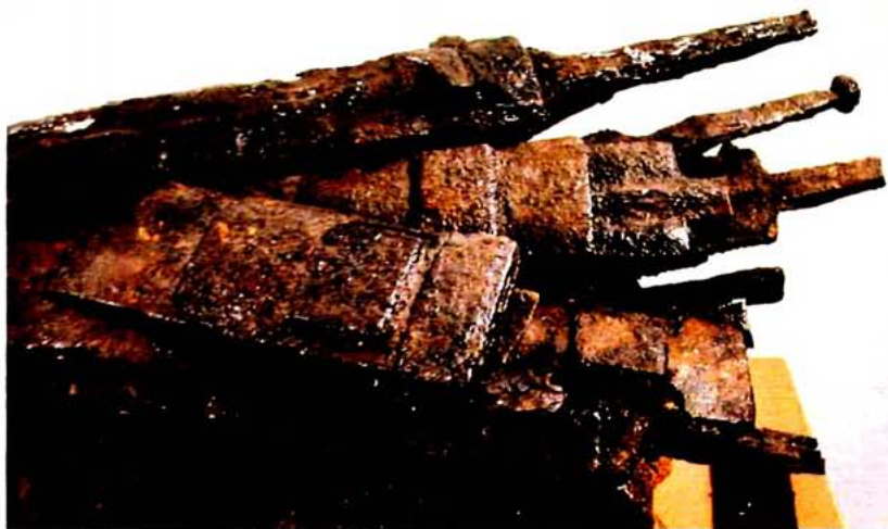
Espases de tipus gal de La Tène II-III. Empúries. Museu de Barcelona.

un metre de fulla, amb talls paral·lels i rectes, únicament utilitzables per a descarregar grans colps de sabre (Donís d'Halicarnàs, I4, I0, I7). En canvi, i encara que no es pot negar que algunes espases de mala qualitat es doblegaren amb facilitat, els estudis recents permeten afirmar que moltes espases de La Tène II-III són de bona qualitat metal·lúrgica (Pleiner, 1993: 159 s.). En tot cas, aquesta qüestió no ens afecta ara perquè, tot i que a Ibèria apareixen nombroses espases rectes de tipus de La Tène I i derivats locals, a penes si n'hi ha, tret de Catalunya, d'espases tallants de La Tène II-III.