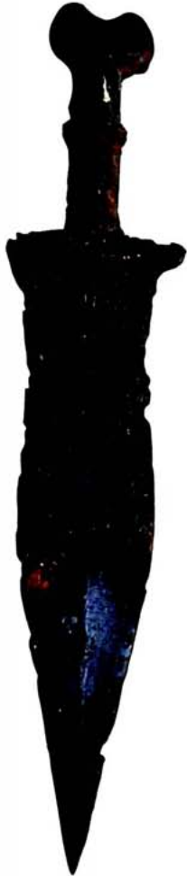
Punyal legionari romà derivat del doble globular celtibèric. Procedent de Huelva. Museu de Cádiz.

un ull i una part dels ossos del cap... Tampoc no reconeixeries el casc que portava, perquè una falcata hispana el partí per la meitat»).