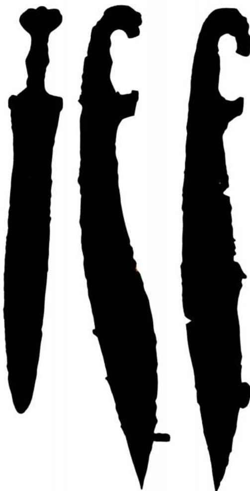
Falcatas ibèriques i espasa de pom arrenyonat derivada de l'espasa de frontó. Las Peñas (Zarra, València). SIP.

Tenim, doncs, per ara, tres dades: els antics romans preferien les espases punxants a les tallants per la seua inherent superioritat; les espases gal·les eren només tallants, i les emprades pels ibers eren mixtes, punxants i tallants. Cal afegir-hi una quarta informació: segons les mateixes fonts antigues, en un moment indeterminat, però probablement entre el 225 i el 200 aC, els romans adoptaren una espasa d'origen ibèric, que denominaren gladius hispaniensis . La font més explícita (tot i que n'hi ha diverses) és un manuscrit bizantí del segle X dC, la Suda , que en aquest cas arreplega un text de Polibi (fr. 96): «els celtíbers difereixen molt dels