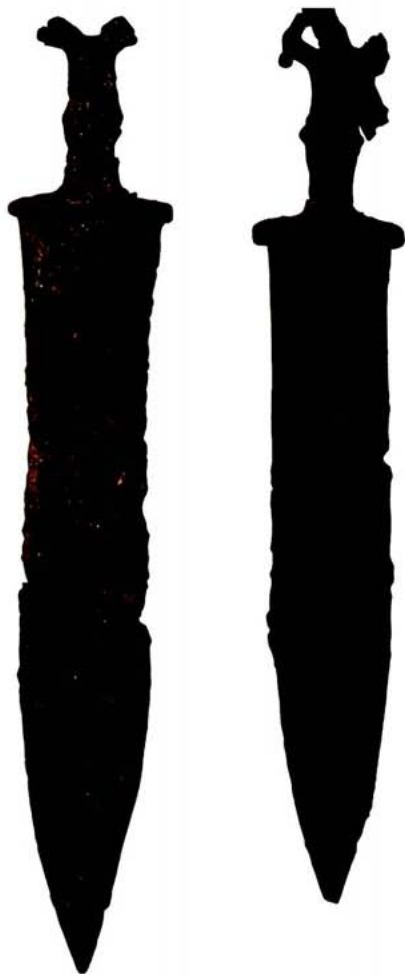
Espases de frontó. Casa del Monte (nord d'Albacete). SIP.

altres en la preparació de les espases. Tenen una punta eficaç de doble fulla tallant. Per això els romans, abandonant les espases dels seus pares, des de les guerres d'Hannibal canviaren les espases per les dels ibers...». Aquest fragment enllaça amb la descripció que fa Polibi de l'espasa romana de la seua època: «l'espasa que duen penjada sobre la cadera dreta i que s'anomena "espanyola". Té una punta potent i fereix amb eficàcia per les dues parts de la fulla, ja que el seu tall és sòlid i fort». (6, 23,6-7.)