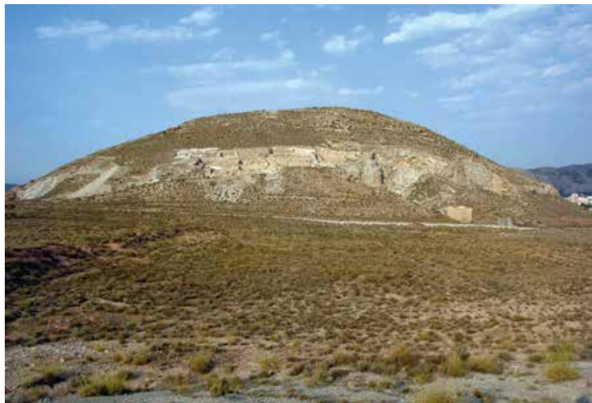
Fig. 5. Vista de Cabezo Redondo.

Villena a augmentar les capacitats productives, a créixer demogràficament i a concentrar una part de la població en un assentament ubicat al centre dels eixos de comunicació: Cabezo Redondo (Fig. 5).