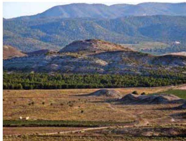
Fig. 4. Vista de Terlinques des de Polovar.

riors, però es distribueixen de manera equidistant, entre 5 i 7 km de distància, i amb àrees d'explotació similars. Entre el repertori material destaca la presència de grans quantitats d'instruments de mòlta de grandàries diverses, vasos ceràmics de gran capacitat i dents de falç, a més d'evidències d'instruments metàl·lics i, en alguns casos, pràctiques de fosa. Assentaments com Terlinques (Fig. 4) van ser fundats ex novo cap al 2100 cal BC, modificats entorn del 1930, transformats plenament cap al 1750 i abandonats entorn del 1500 cal BC (Jover i López, 2009; Hernández, Jover i López, 2013). Aquesta mateixa seqüència podria ser extensible a la resta d'assentaments de característiques semblants.