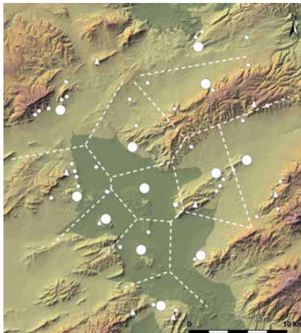
Fig. 2. Mapa amb l'aplicació dels polígons de Thyessen, prioritzant la dimensió dels assentaments.

Grup B. Assentaments de tipus Polovar. Es tracta de nuclis de grandària molt reduïda, inferiors a 800 m 2 . Ocupen el cim i els vessants de grans turons aïllats ubicats enmig del corredor o en contraforts muntanyosos avançats de les serres que delimiten la cubeta de Villena, amb una altura sobre el fons de la vall inferior als 90 m, i disposen d'una visibilitat àmplia i bones terres al seu entorn per a la pràctica agrícola. Una anàlisi del veí més pròxim, corregida fins al tercer veí, unida a un estudi de polígons de Thyessen , va permetre inferir un patró agrupat entorn dels jaciments més grans i uniformes respecte a si mateixos (Jover i López, 1999) (Fig. 2). El registre material mostra pràctiques de caràcter domèstic i agropecuari, però sempre amb una enorme escassetat d'evidències i sense mostres de producció metal·lúrgica. Un