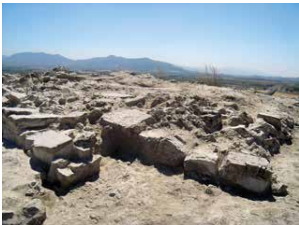
Fig. 3. Àrea occidental de Polovar en procés d'excavació. En primer terme s'observa la plataforma de terrasses.